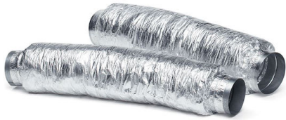
Kanalisierung flex schalldämpfend Ø 120 9700 602