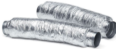
Kanalisierung flex schalldämpfend Ø 150 9700 603